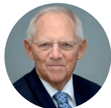
DR. WOLFGANG SCHÄUBLE Präsident des Deutschen Bundestages a. D.

„Gemeinsinn, Verantwortungsbewusstsein und Kameradschaft – unsere freiheitliche Demokratie kann ohne Grundwerte nicht bestehen! Bei der Feuerwehr lernen Jugendliche weit mehr, als Brände zu löschen: Sie helfen anderen, indem sie verlässlich, überlegt und im Team reagieren. Und sie erfahren bei ihrem Einsatz, wie wichtig es ist, sich aufeinander verlassen zu können. Damit leisten die Jugendfeuerwehren einen wichtigen Dienst für unser demokratisches Gemeinwesen!“