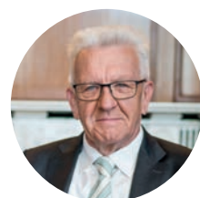
WINFRIED KRETSCHMANN Ministerpräsident des Landes Baden-Württemberg

„Das Fundament für den gesellschaftlichen Zusammenhalt sind die grundlegenden Werte unserer Verfassung. Sie ermöglichen allen Menschen, sich frei zu entfalten, solange die Rechte anderer dadurch nicht verletzt werden. Diese Werte müssen wir immer wieder bekräftigen und verteidigen. Um eine Kultur der Vielfalt und des Respekts zu pflegen und zu stärken, ist es essentiell, dass alle gesellschaftlichen Akteure an einem Strang ziehen. Mit KaReVeTo leistet die Jugendfeuerwehr Baden-Württemberg einen wichtigen Beitrag in der Demokratiebildung und fördert aktive Teilhabe und Verantwortungsbewusstsein.“